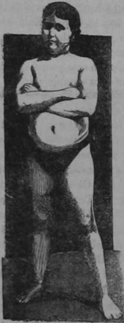
EDAD 11 AÑOS

La transformación maravillosa de un sér endeble y raquítico en un adolescente fuerte, robusto y sano, como lo demuestra su atlética figura, fué obra realizada por la